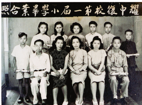
1946年二次大戰後耀中復校後首屆畢業生