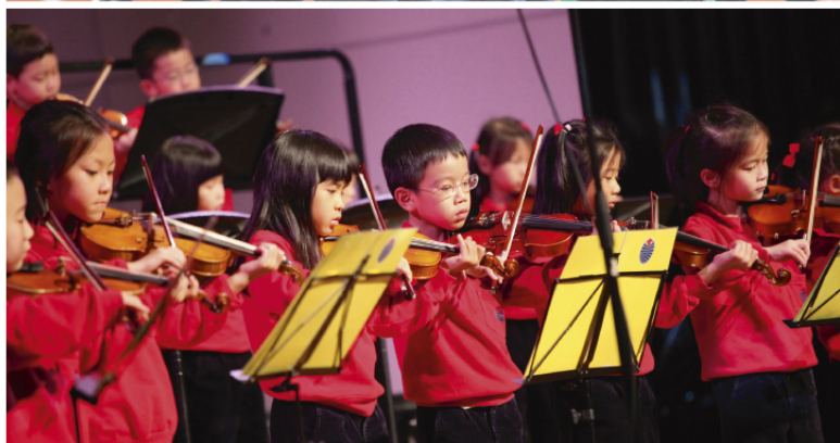
耀中致力提供全面而均衡的教育