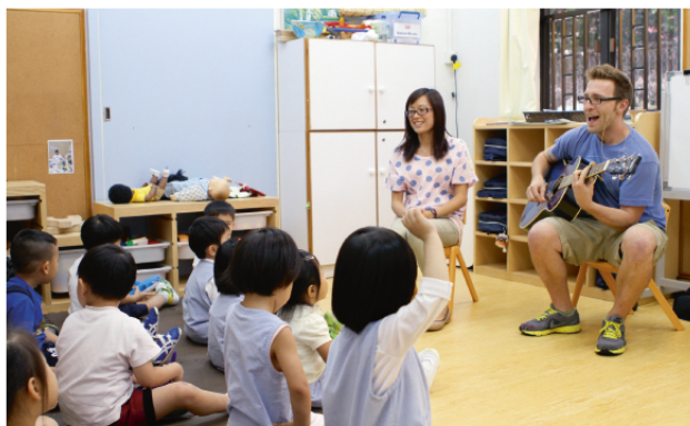
中外雙老師合作教學模式為學生創造東西文化兼融的學習環境

今日的耀中，包括了幼稚園、小學和中學，學制涵蓋幼兒、小學、中學和國際文憑大學預科課程 IB，實施「一條龍」優質教學。2008年，耀中更成立社區書院，以向本港學子提供另一升讀大學途徑，為他們的未來開拓更多的出路。耀中社區書院設有副學士課程，亦計劃申辦學士學位課程，這也標誌著耀中開始關注專上教育領域。