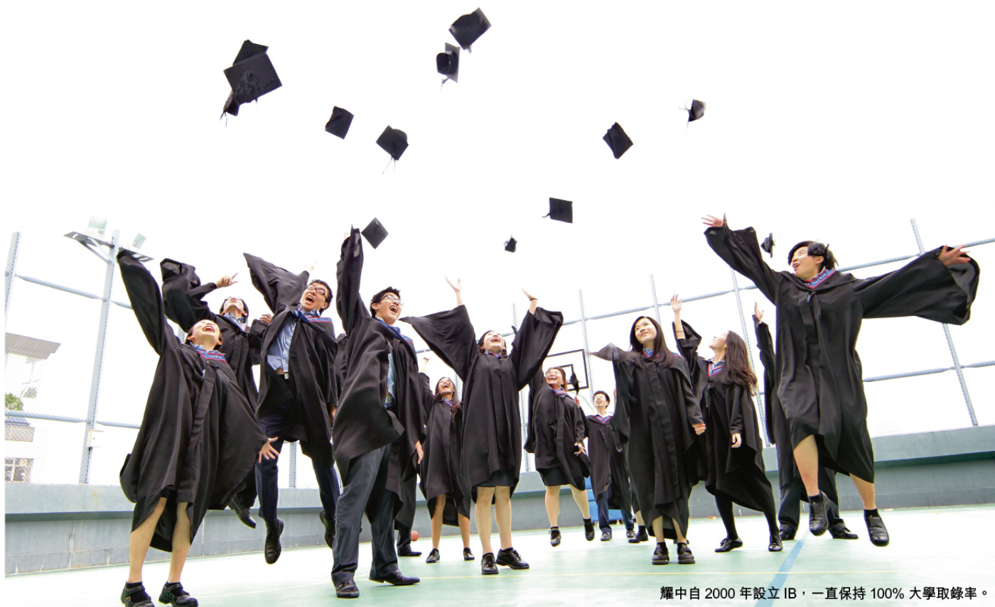
耀中自2000年設立IB，一直保持100%大學取錄率。