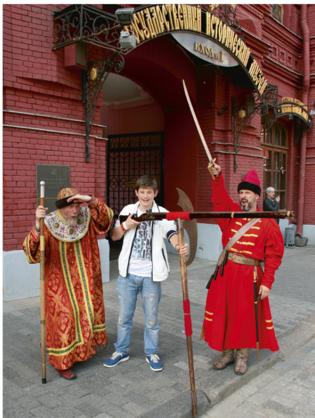
「世界教室」課程讓學生可以體驗不同文化風尚