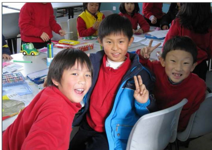
耀华提倡全人教育 愉快学习

在耀华国际教育学校老师的眼里，每个孩子都是独特的，都有天才的一面。善于发掘学生的潜能并鼓励其全面发展，正是耀华提倡的“全人教育”精髓所在。耀华不仅要求学生有优秀的学业成绩，而且要促进学生的全面发展。很多课外社团活动等都将都是耀华学生的必修课。