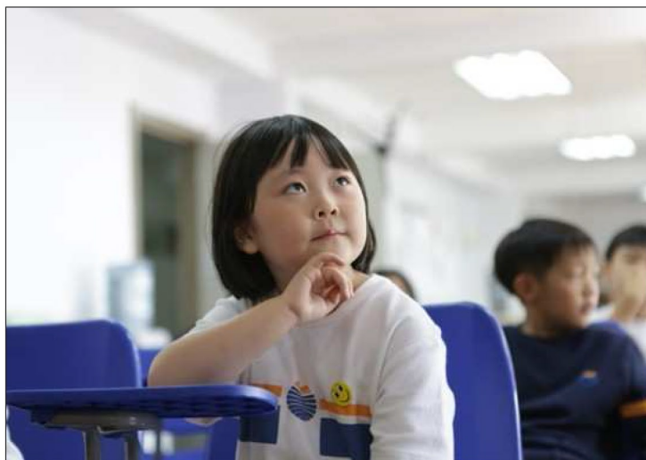
独立思考让孩子学会明辨是非

然而随着社会的进步和发展，拥有自主学习、批判性思考和跨文化交流能力的人才逐步获社会认可。若要培养学生具备以上的能力，就需要学校和家庭给学生足够的空间和包容度，允许学生提出自己的见解和看法，并通过不断提问和论证答案来完善观点，学生从而在研习的过程中学会思考。