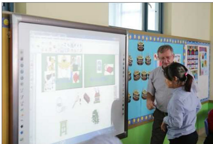
耀华非常注重培养学生多角度的思维能力

在耀华的课堂上，教师会为学生的思考留出最大的空间，培养学生独立的看法，并且创造条件为学生提供丰富的材料和多元的意见，鼓励他们抱持怀疑态度并运用批判性思维。