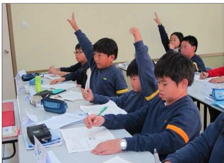
从学会提问开始学习独立思考

在耀华的课堂上，教师会为学生的思考留出最大的空间，培养学生独立的看法，并且创造条件为学生提供丰富的材料和多元的意见，鼓励他们抱持怀疑态度并运用批判性思维。