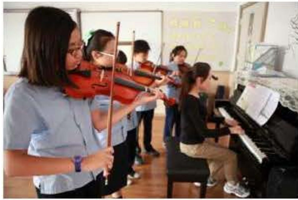
课堂以外的学习既增长技艺又陶冶情操

善于发掘学生的潜能并鼓励其全面发展，正是耀华提倡的“全人教育”精髓所在。耀华不仅要求学生有优秀的学业成绩，而且要促进学生的全面发展——学生不仅可以和外教讲流利的英语，还可以熟练地演奏各种中西方的乐器；运动场上经常看到学生留下与专业体育外教切磋体育技能的身影；学生在老师的指导下组织各种社团，极大地锻炼了领导力及团队协作能力。